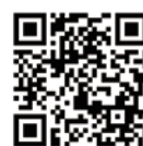
定例会配信動画 (代表・一般質問)